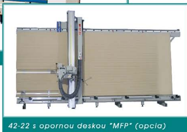
42-22 s opornou deskou "MFP" (opcia)