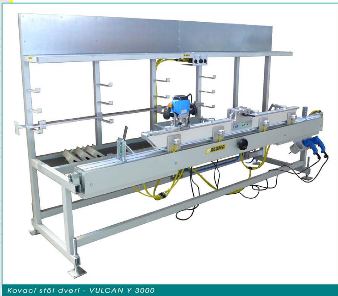
Kovací stôl dverí - VULCAN Y 3000