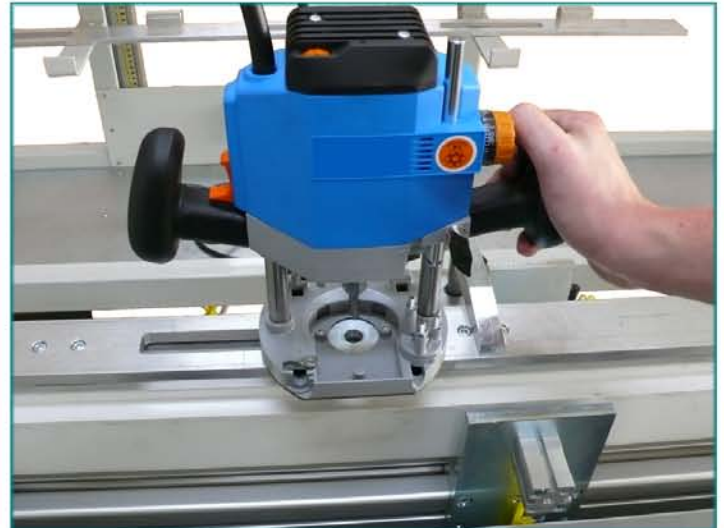
frézovanie drážky podľa šablóny