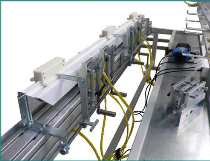
detail integrovaného mechanického systému pre rozloženie dverných závesov