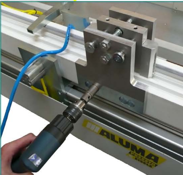
predvrtanie diery pre vloženie zámku