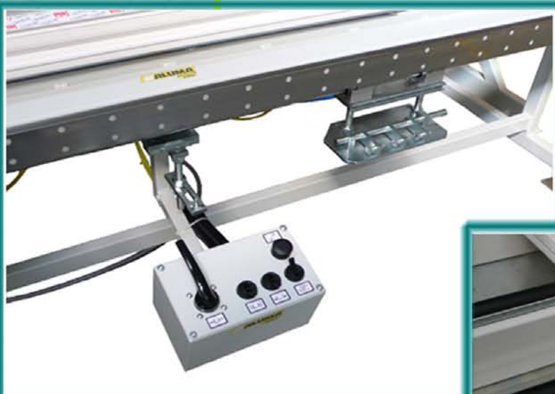
Gépközvetítés a középen elhelyezkedő vezérlőpultról