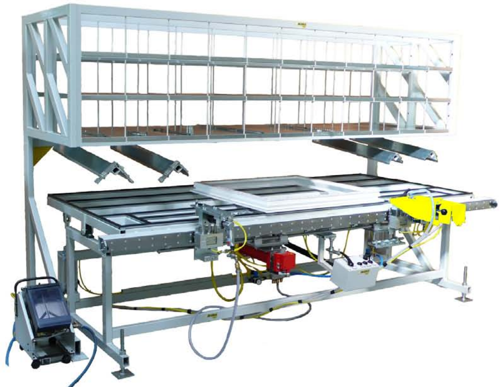
Szárnyra szerelő központ VULCAN S