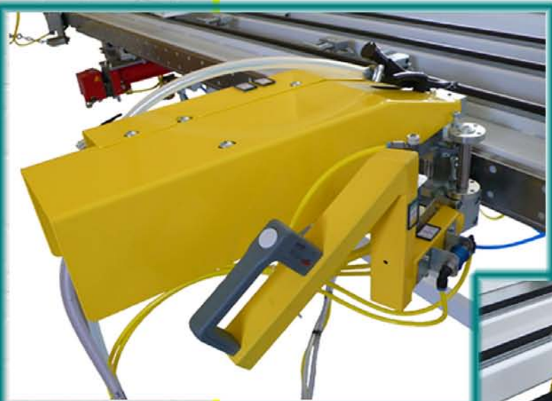
Mozgatható csavarbehajtó automata csavaradagolóval