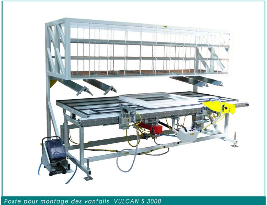
Poste pour montage des vantails VULCAN S 3000