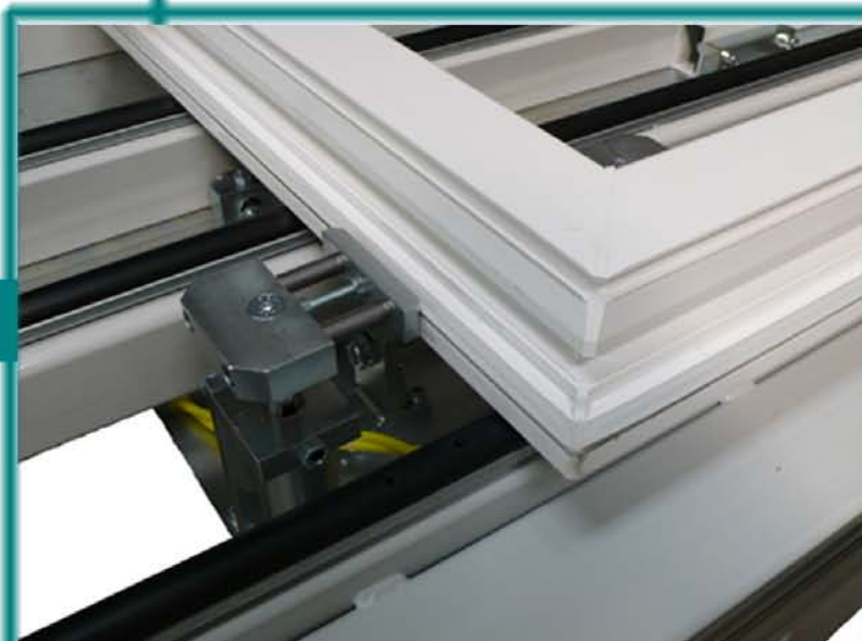
Butées amovibles à droite et à gauche placés pneumatiquement pour définir le longueur de forgeage