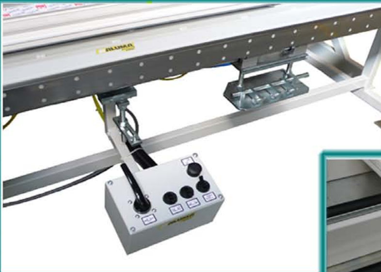
Steuerung vom Zentralpanel