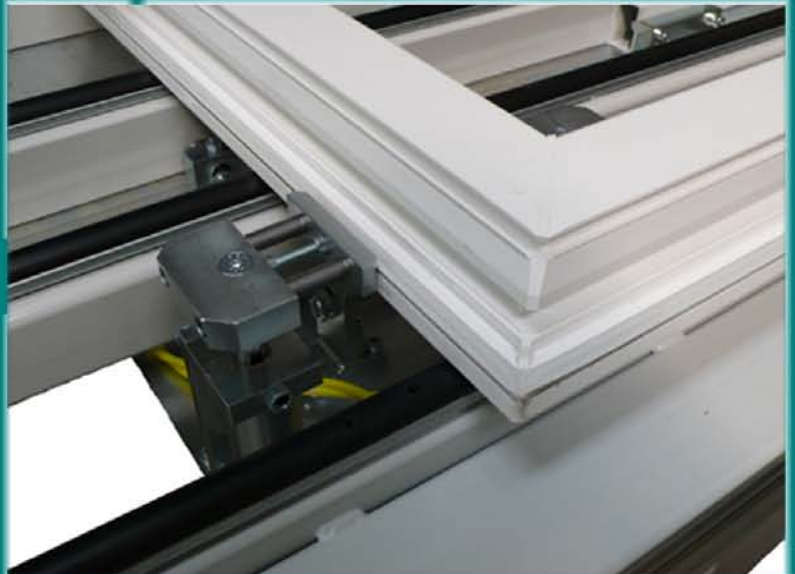
Abtastanschlge rechts und links, pneumatisch absenkbar fr die Beschlag-Lngenermittlung