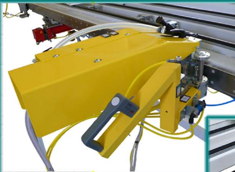
Schraubeinheit fahrbar mit pneumatischem Zufhrgert