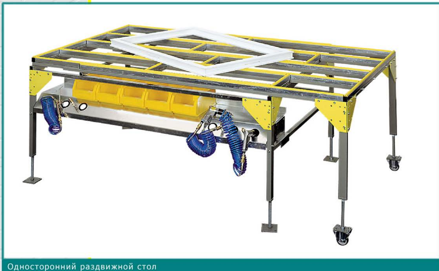
Односторонний раздвижной стол