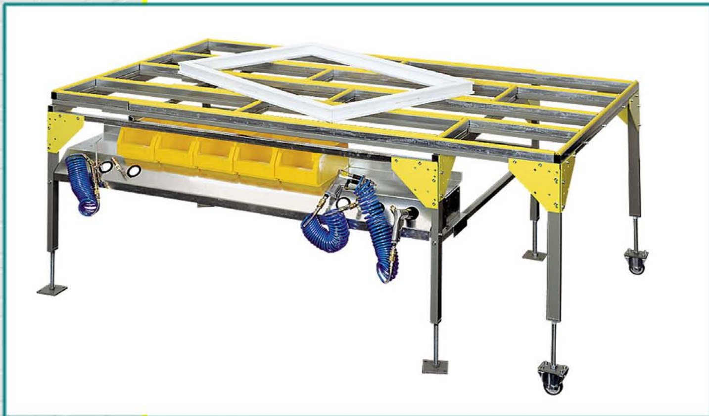
Stolovi sa izvlačenjem na jednu stranu