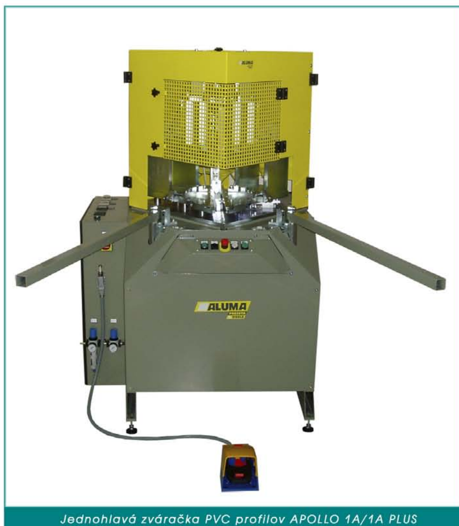
Jednohlavá zväračka PVC profilov APOLLO 1A/1A PLUS