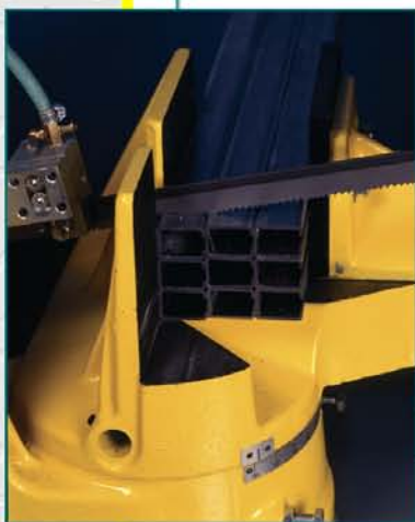
Pásová píla ARG 250/ARG 250 PLUS